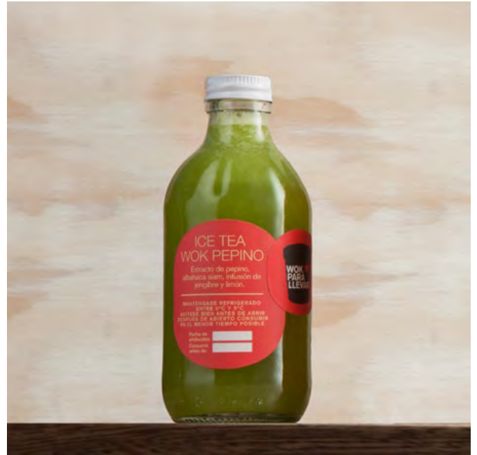
ICE TEA WOK PEPINO Extracto de pepino, albahaca siam, infusión de jengibre y limón. $11.900