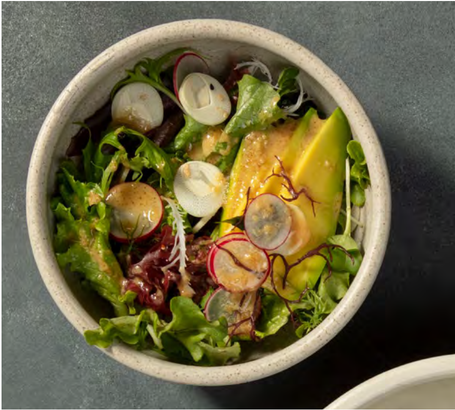
ENSALADA CON AGUACATE Y ALGAS Mezcla de lechugas orgánicas, aguacate, palmito del putumayo, ajonjolí, rábano y algas con vinagreta de jengibre. $22.900