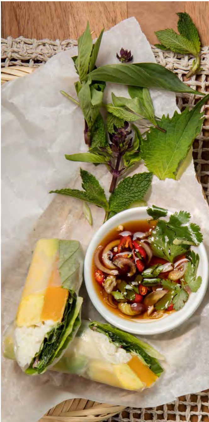
ROLLITOS DE PAPEL DE ARROZ DE VEGETALES Zapallo, lechuga, aguacate, jícama remoulade, mayonesa, germinados y salsa vietnamita a base de soya (sin nam-pla). $20.700