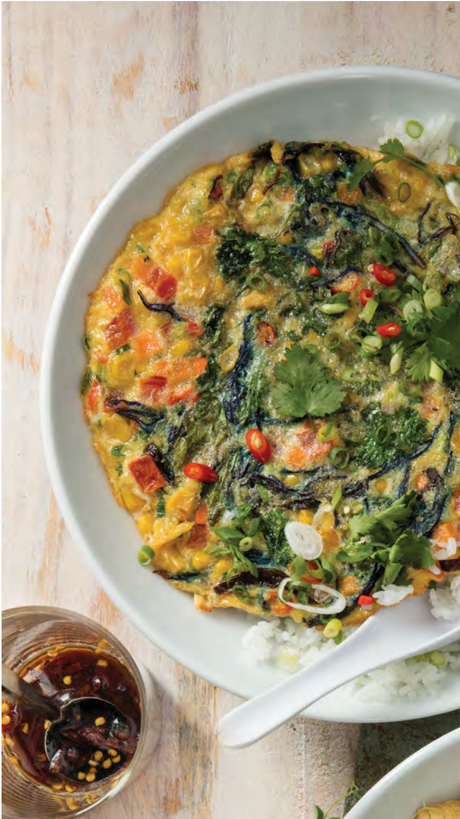
OMELETTE THAI 🔥 Tortilla de huevo con vegetales, albahaca siam, cilantro, setas (oreja de madera), chile y salsa soya. Servido sobre arroz jasmín o integral. $19.900