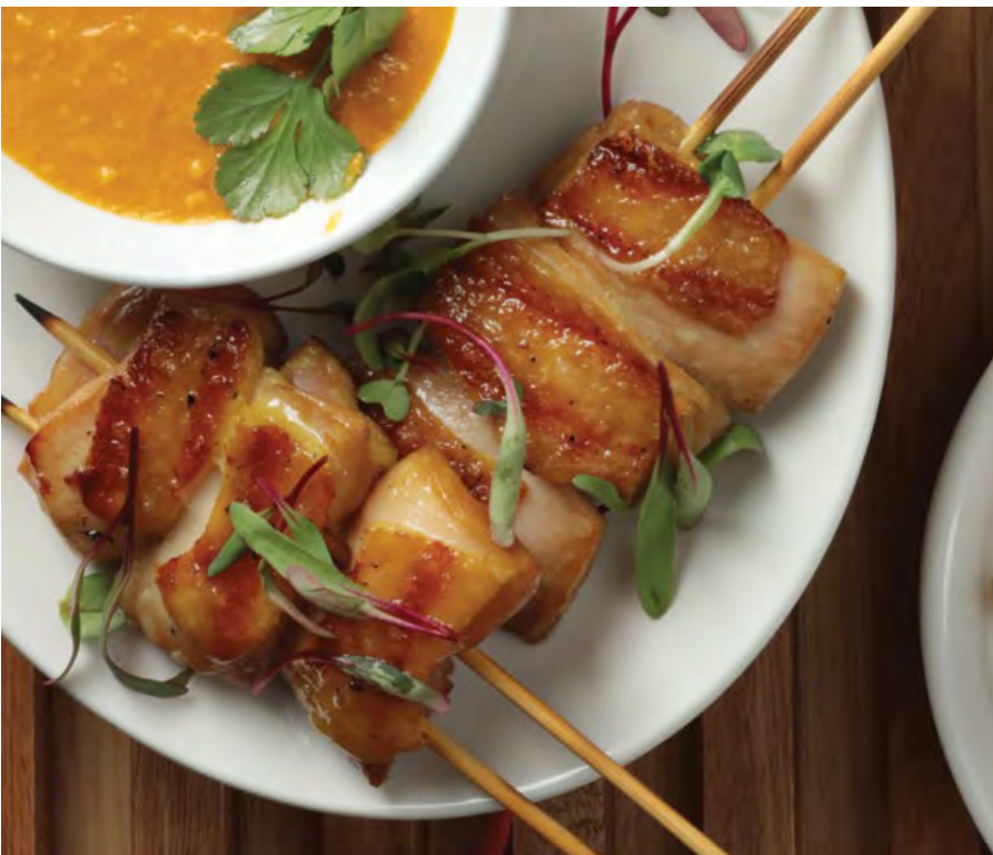
SATAY CONTRAMUSLO DE POLLO Marinados con una infusión de salsa soya y servidos con salsa a base de leche de coco y maní. $26.900