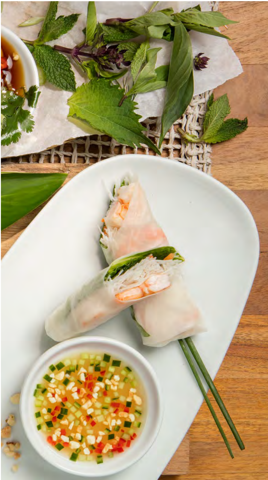
ROLLITOS DE PAPEL DE CAMARÓN (2 unidades) Camarones con pasta vermicelli de arroz, lechuga, hierbas y zanahoria. Servidos con salsa vietnamita con nam-pla y maní. $23.800