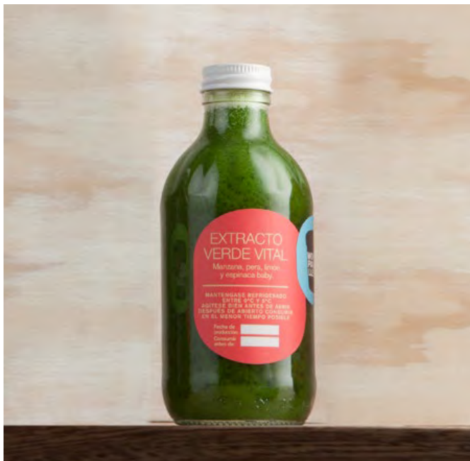
EXTRACTO VERDE VITAL Extracto de manzana, pera, limón y espinaca baby. $16.400