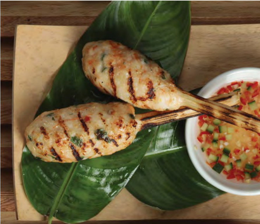
CHAO TOM Camarones aromatizados en caña de azúcar, servidos con salsa vietnamita con nam-pla y maní. $29.900