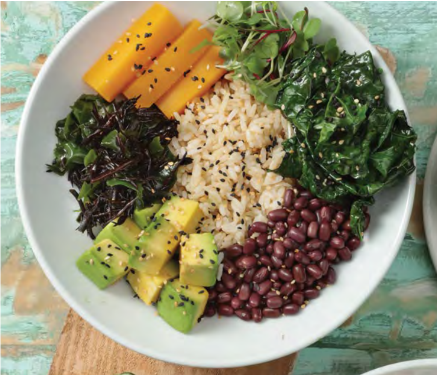
BOWL MACROBIÓTICO Arroz integral, zapallo, kale, algas marinas, aguacate, frijol azuki, germinados y ajonjolí, servido con salsa de miso tahine con miel, aceite de oliva y limón. $29.900