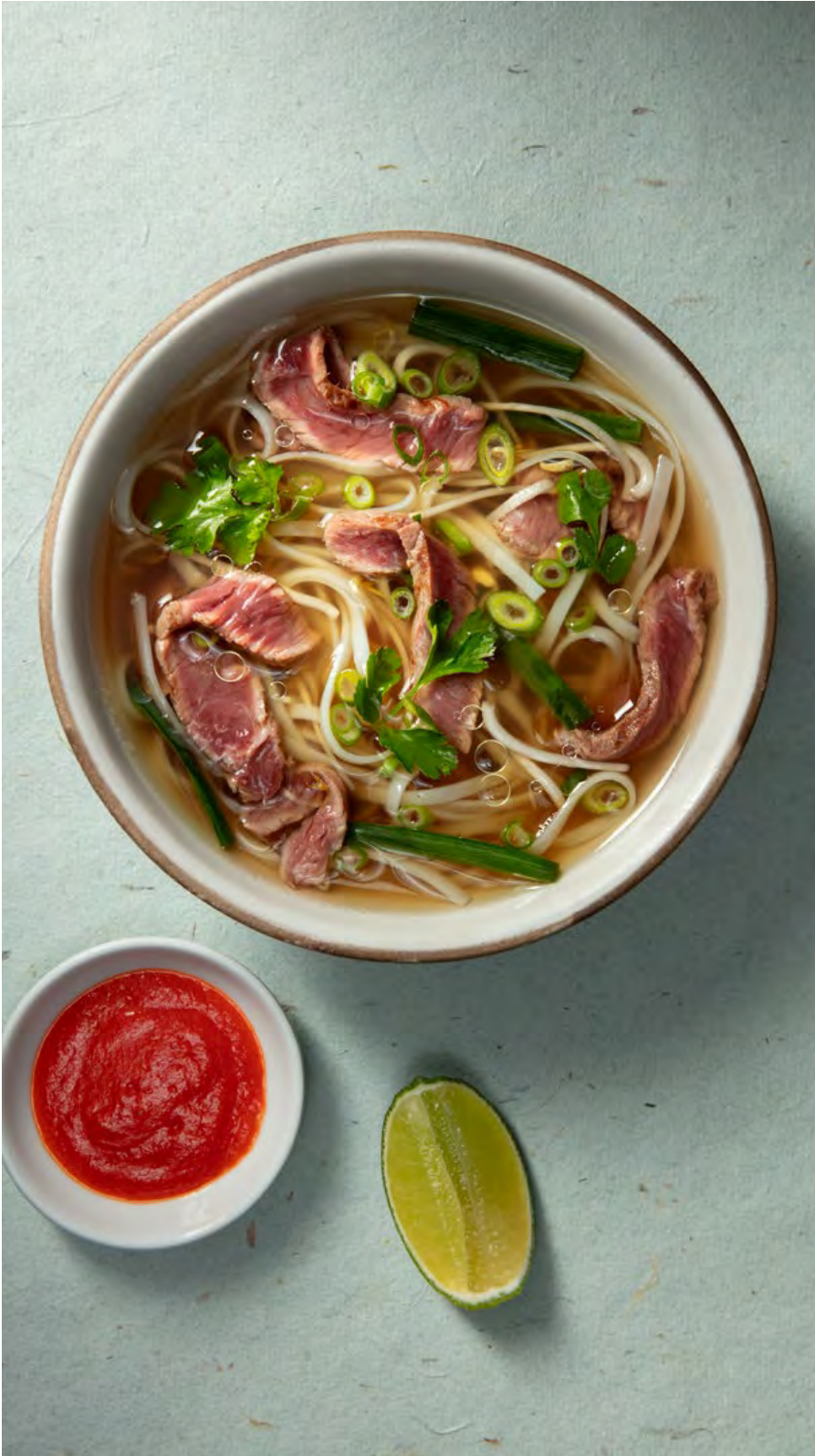
VIETNAMITA CON CADERA DE RES Consomé de pollo, con pasta de arroz, salsa de ostras, cebollín oriental y cilantro. Servida con salsa sriracha y limón. $37.900