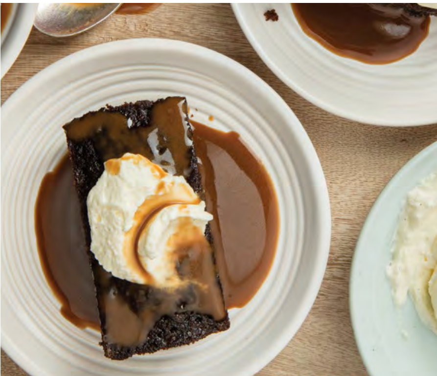
STICKY TOFFEE PUDDING Para calentar en casa $15.900