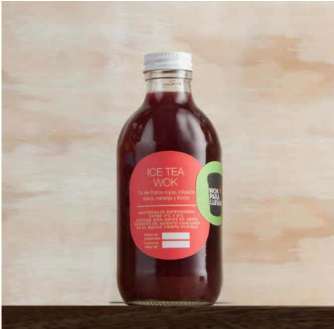
ICE TEA WOK Té de frutos rojos con infusión spicy, naranja y limón. $14.500