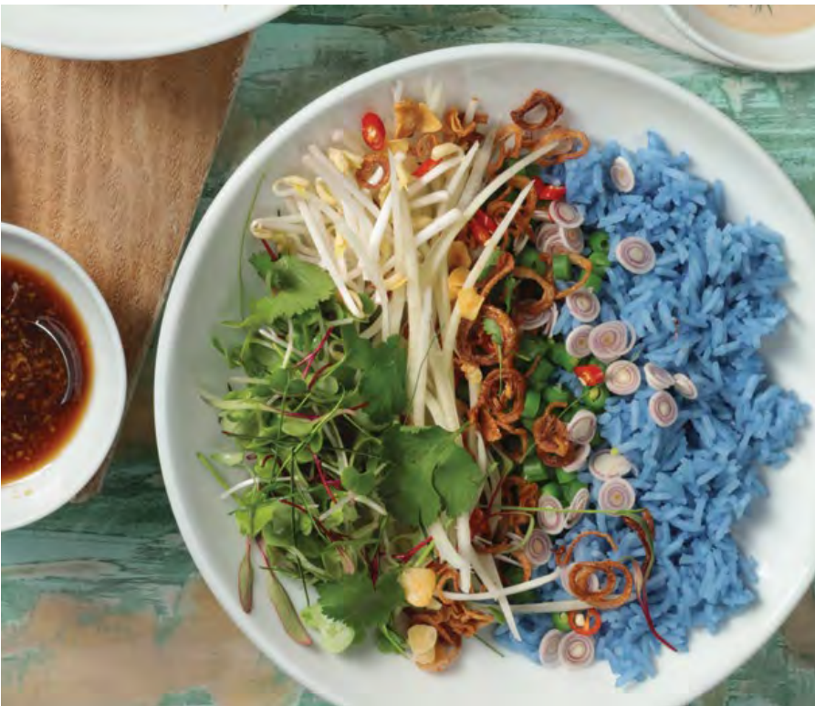
THAI SALAD BOWL 🔥 Arroz jazmín en infusión de flores, raíz china, cortes de papaya verde, habichuelín, limonaria, cilantro, germinados, cebolla ocañera crocante, hojas de limón kafir, chips de ajo y chile. Servida con una vinagreta a base de soya y jengibre. $23.900