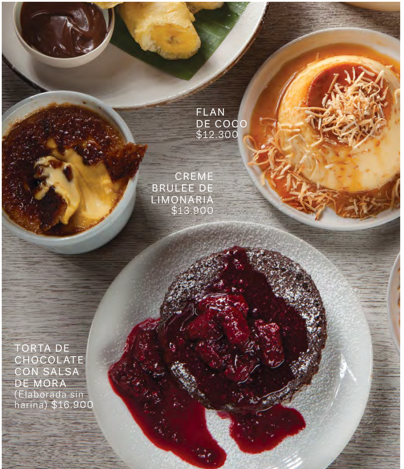
FLAN DE COCO $12.300