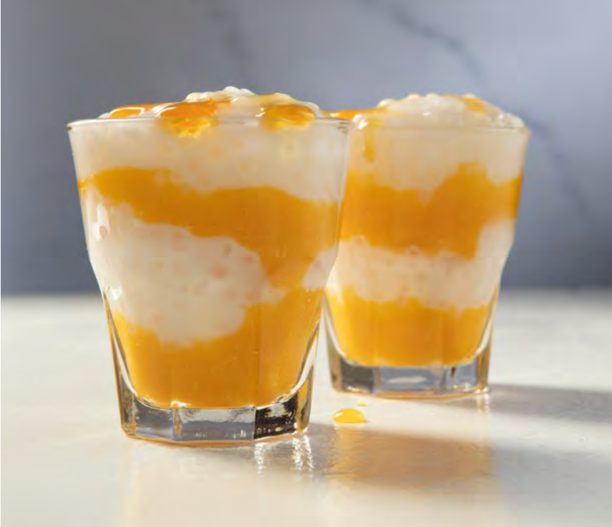
TAPIOCA CON MANGO $8.900