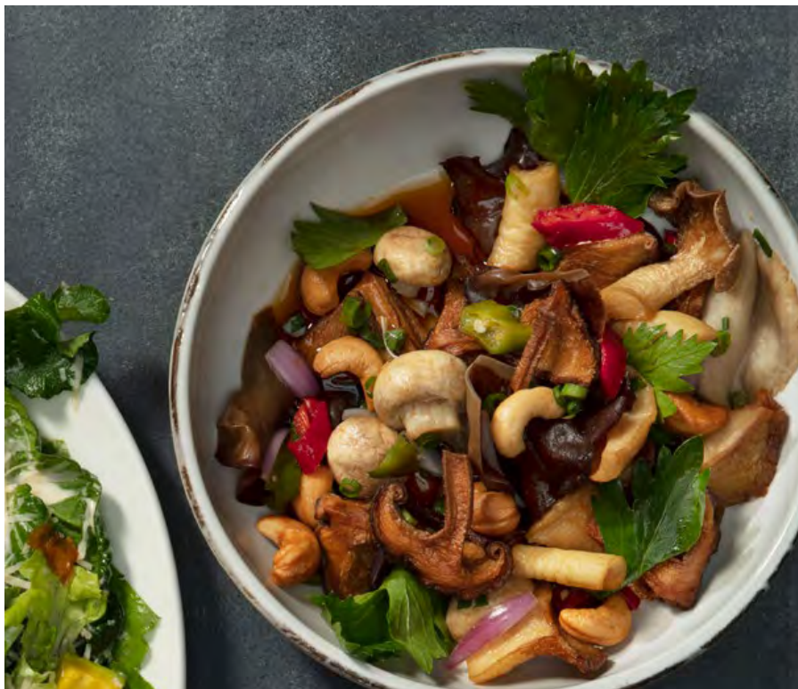
SETAS THAI 🔥 Variedad de setas, cebolla ocañera, chile, marañón, cebollín oriental, hojas de apio, ajo y vinagreta thai con salsa soya. $39.900