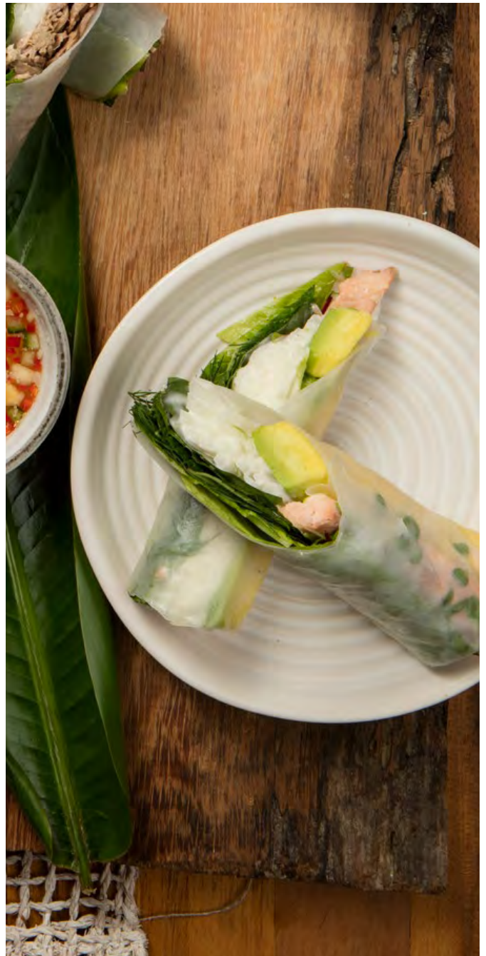
ROLLITOS DE PAPEL DE ARROZ DE TRUCHA Trucha ahumada, lechuga, jícama remoulade, mayonesa, aguacate, hierbas y germinados. Servidos con salsa vietnamita con nam-pla y maní. $28.900