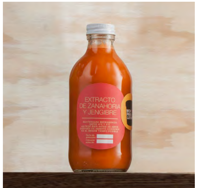
EXTRACTO DE ZANAHORIA Y JENGIBRE $12.400